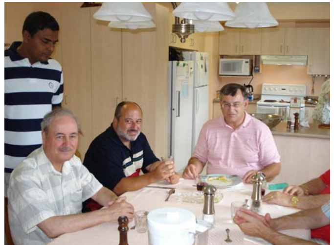
En la casa central de Trois-Rivières en julio de 2009