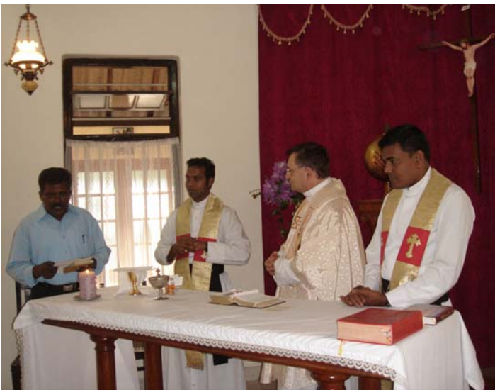
Viaje a Sri Lanka, en febrero de 2009

Me es agradable estar al servicio del Instituto a título de director general. Eso fue para mí una experiencia de fe y de profundización de la espiritualidad de los 5-5-5. Gracias por haber confiado en mí y por haberme sostenido por su amistad y su oración. La historia de amor comenzada en 1978 en el momento de mis primeros contactos con el Instituto, se continúa ahora de una manera diferente.